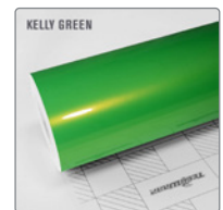
KELLY GREEN RB22