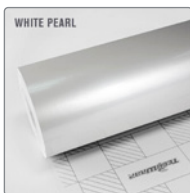
WHITE PEARL CK522